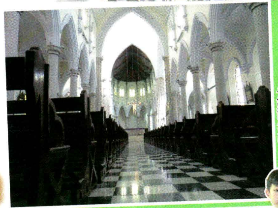
於主教座堂