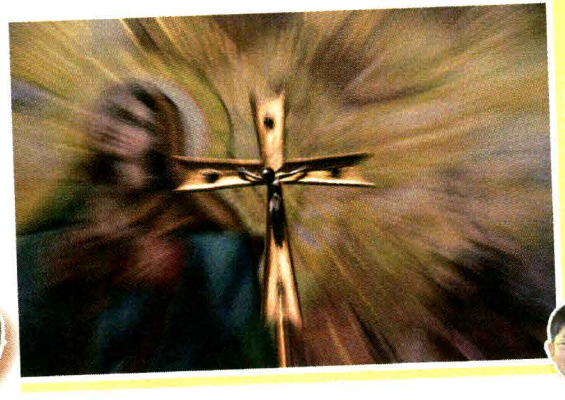
康政作品《耶穌的苦衷》